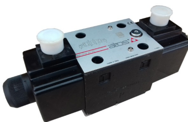
Гидрораспределитель DKE с катушками переменного тока (AC).