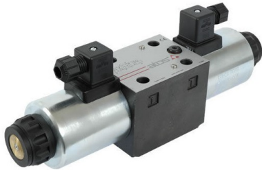
Гидрораспределитель DKE с катушками постоянного тока (DC).